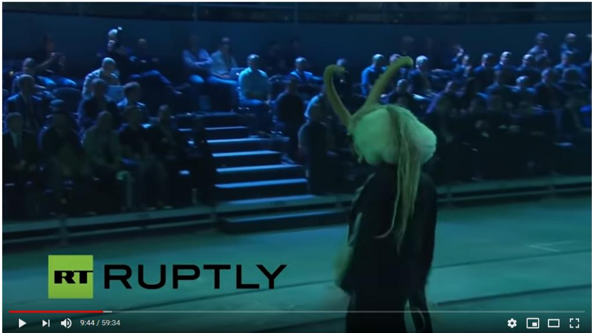
Full Bizarre, Demonic Gotthard Tunnel Opening Ceremony, Satanic, New World Order, Illuminati Ritual